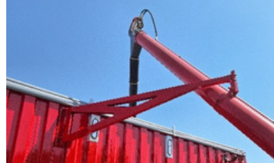
Nuevo sistema de bandera.