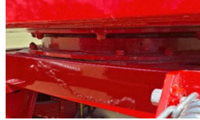
Aro giratorio del tren delantero.