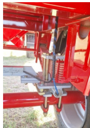
Eje delantero y suspensión. Opcional: Balanza.