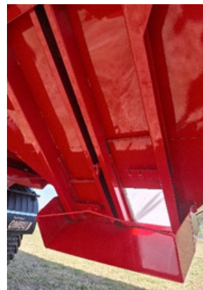
Bandeja de descarga.