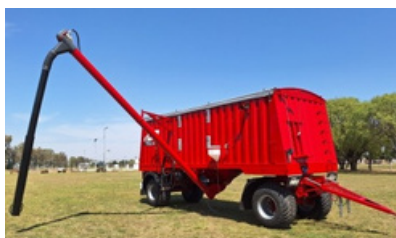
Descarga a sinfín.