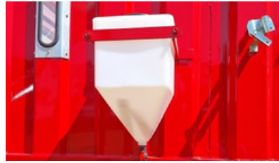
Depósito para inoculante.