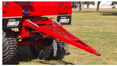
Lanza y tren delantero.