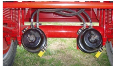
Opcional: eje con frenos de 8".