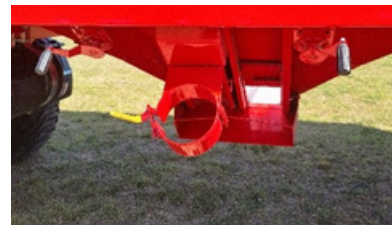
Nuevo sistema de apertura boquilla, con piñón y cremallera.