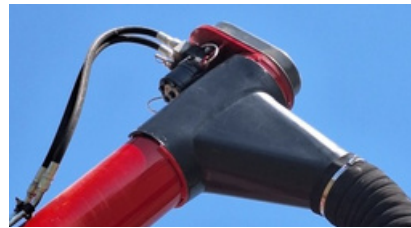
Boquilla de descarga giratoria.