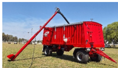
Sistema de autorcarga.