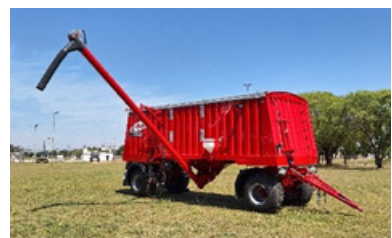
Sistema de descarga. (adaptable a sembradoras Air drill)